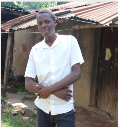
Nicholas Education science (Mathematic & Physics)

Herzlichen Dank an alle Patinnen & Paten!