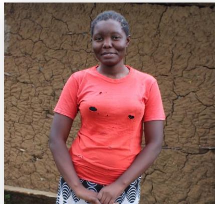
Shalline Education science (Mathematic & Physics)